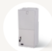
APPAREIL DE TRAITEMENT D'AIR 45MBAA

1 L'appareil intérieur 45MPHA est compatible avec les thermopompes Infinity suivantes : 37MPRA et 37MGHA.