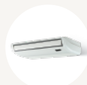
SOUS LE PLAFOND 45MCFA