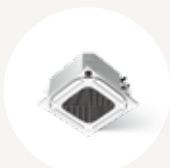
CASSETTE 4 VOIES 45MBCA

Les cassettes offrent un débit d'air silencieux et uniforme; elles occupent peu d'espace au mur ou au sol et sont idéales pour les dispositions à aire ouverte et les pièces à usages multiples.