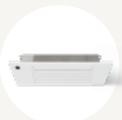
CASSETTE UNIDIRECTIONNELLE 45MCCA