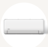
PERFORMANCE MURAL 45MAHA