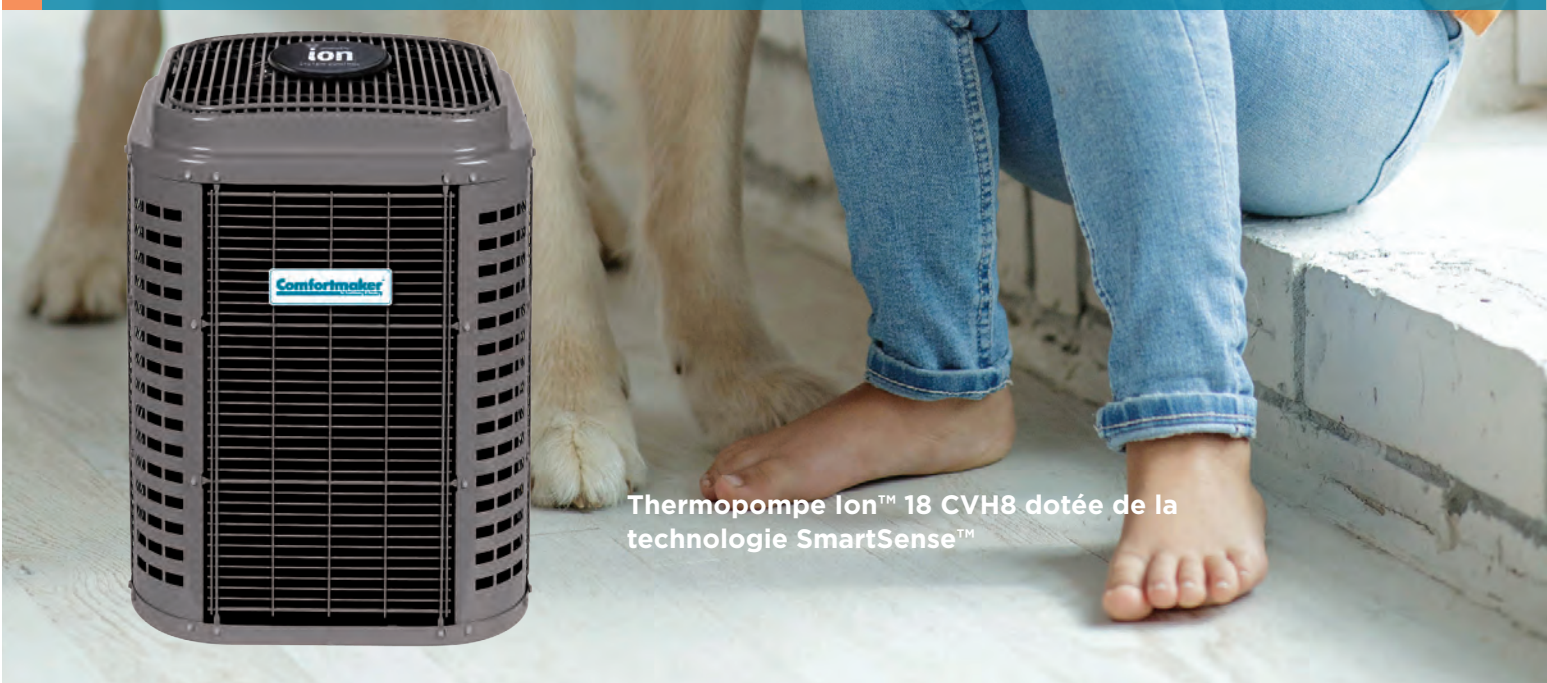
Thermopompe Ion™ 18 CVH8 dotée de la technologie SmartSense™