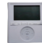
Télécommande filaire (programmable sur 7 jours) KSACN0401AAA

Télécommande filaire en option KSACN0401AAA (programmable sur 7 jours)