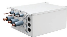
Boîtier de dérivation Requis sur les appareils de capacités comprises entre 48 et 56