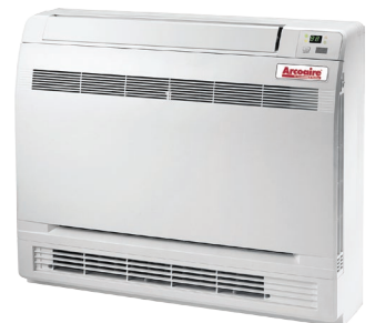
Console au plancher