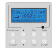
Commande à distance filaire optionnelle KSACN0201AAA Non disponible pour les modèles DLFA et à console de plancher