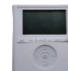
Télécommande filaire (programmable sur 7 jours) KSACN0401AAA

Télécommande filaire en option KSACN0401AAA (programmable sur 7 jours)