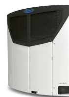
VECTOR HE 19 Intensiv brug og multitemp.