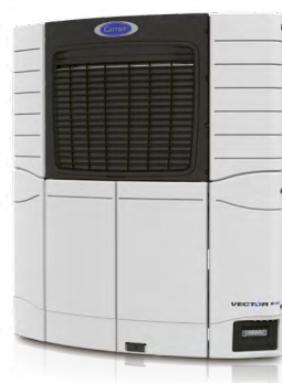
VECTOR S 15 Effektiv og designet til nem vedligeholdelse

Vector S 15 positionerer sig som en pålidelig, støjsvag og effektiv løsning med semi-elektrisk teknologi samt nem vedligeholdelse og brug, der komplementerer de fuldt elektriske Vector HE 17 og flagskibet Vector HE 19-anlæg.