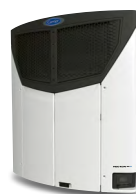
VECTOR HE 17 Äußerst effizient und vielseitig