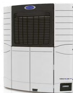
VECTOR S 15 Eficiente y diseñado para un fácil mantenimiento

La Vector S 15 se posiciona como una solución fiable, silenciosa y eficiente, con tecnología semieléctrica de fácil mantenimiento y uso, que complementa a los equipos totalmente eléctricos Vector HE 17 y al emblemático Vector HE 19.