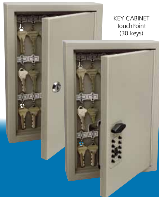
KEY CABINET TouchPoint (30 keys)