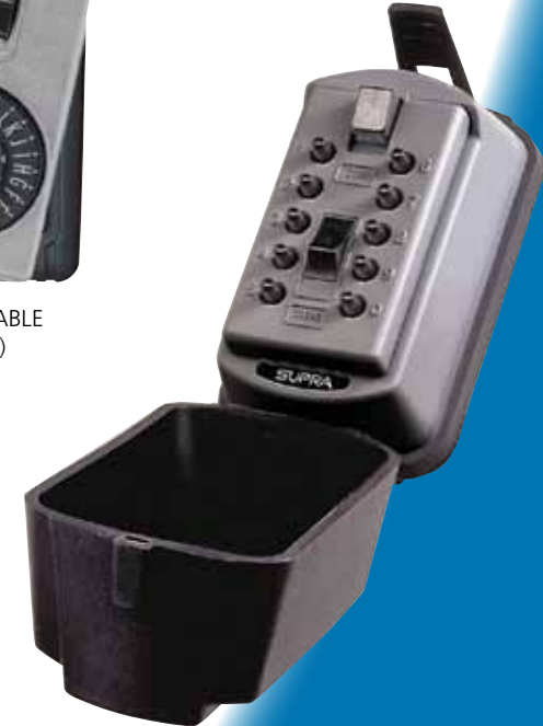
2-KEY PERMANENT AUTO