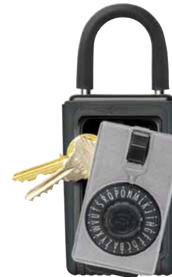
3-KEY PORTABLE (spin dial)