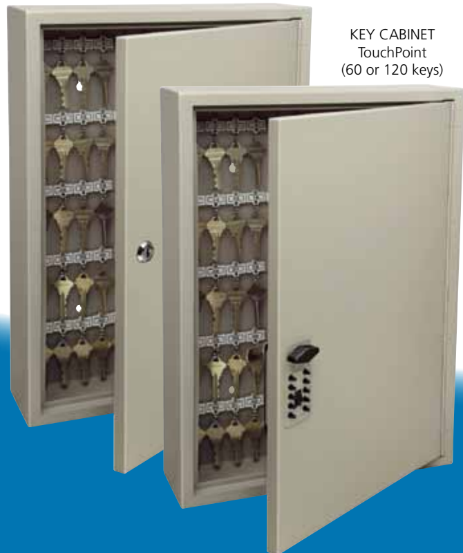
KEY CABINET TouchPoint (60 or 120 keys)