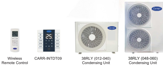
Wireless Remote Control