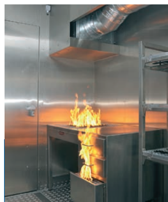
Feux de bureau