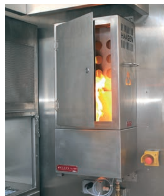
Feux d'armoire électrique