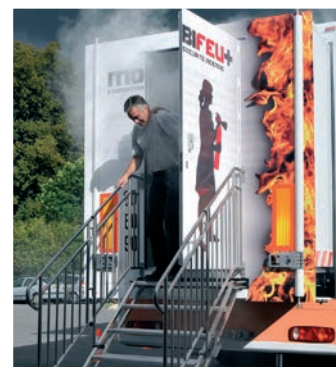
Exercice d'évacuation en zone enfumée