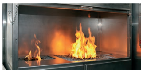
Feux de sorbonne