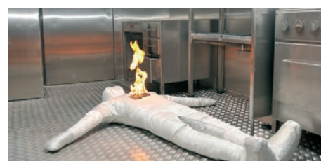
Feux de personne