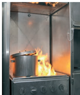
Feux de cuisine