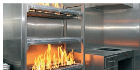
Feux de stockage