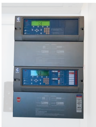
SSI de catégorie A