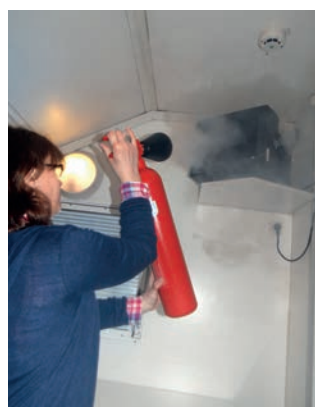
Feu d'origine électrique