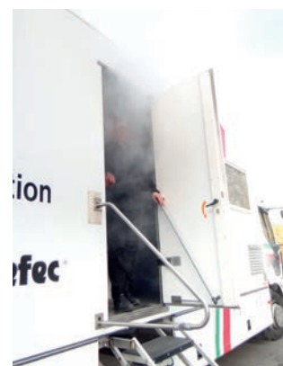
Exercice d'évacuation en zone enfumée